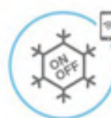
Application de commande à distance