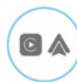
Apple CarPlay™ & Android Auto™

Deux écrans, 7" pour le conducteur et 10,25" pour l'infodivertissement, créent une ambiance moderne. Le système d'infodivertissement, compatible avec Apple CarPlay et Android Auto, vous permet de rester connecté(e) en toute simplicité.