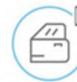
Verrouillage/déverrouillage du véhicule