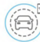
Diagnostic du véhicule