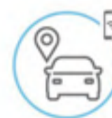
Géolocalisation du véhicule